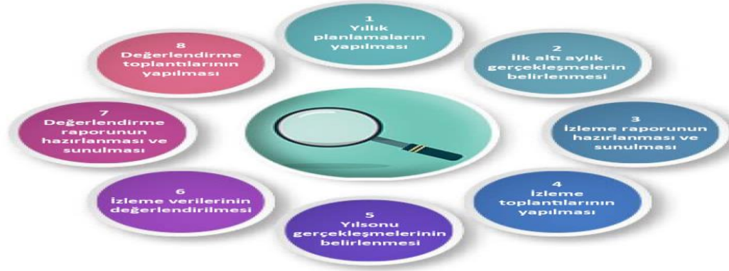
Şekil-4 İzleme ve Değerlendirme Süreci

İzleme ve değerlendirme sürecinin işleyişi ana hatları ile yukarıdaki şekilde özetlenmiştir.